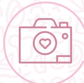
Fotos digitales de los mejores momentos del viaje

Nota: los obsequios pueden tener alguna modificación en cualquier momento