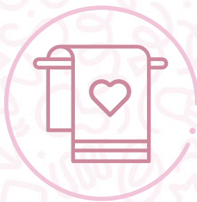
Toalla playera microfibra