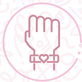
Manilla Dreams 15