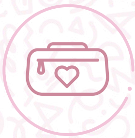
Cartuchera marca Totto