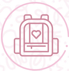
Morral marca Totto.