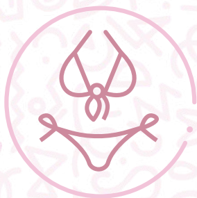
Vestido de baño marca ST Even.