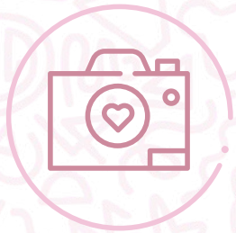
Fotos digitales de los mejores momentos del viaje