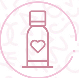
Termo en acero inoxidable