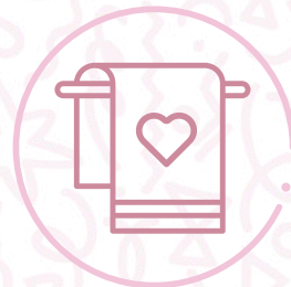
Toalla playera microfibra