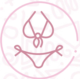
Vestido de baño marca Maaji.