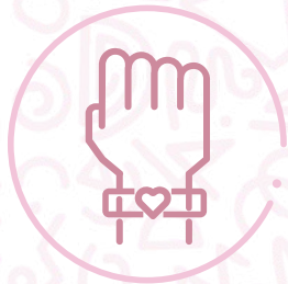
Manilla Dreams 15

Nota: los obsequios pueden tener alguna modificación en cualquier momento