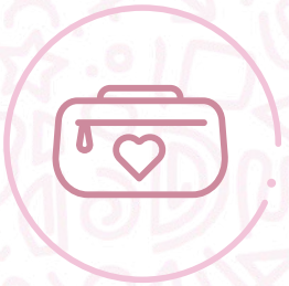
Cartuchera marca Maaji