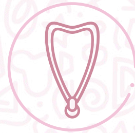
Strap para el celular.