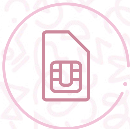
SIM card de Conecty ¡para siempre estar conectada!